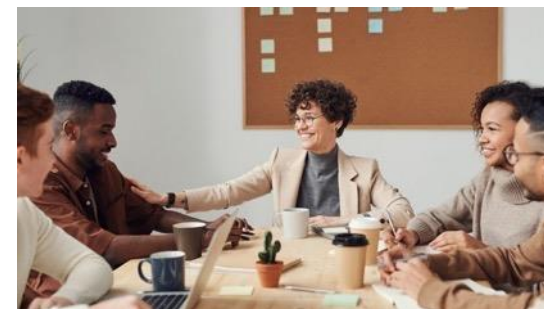
Relations et conditions de travail