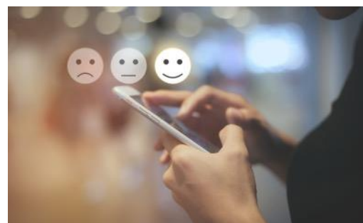
Intérêts des consommateurs