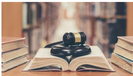
Respect des droits des personnes