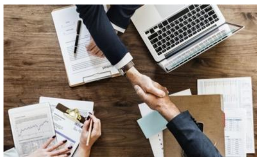
Relations avec ses fournisseurs